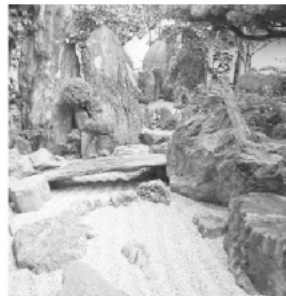
Bild: Steingarten Dasan in Tempel, Oarakuji, Kyoto