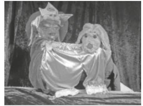
Am Sonntag, 12.01. um 15:00 Uhr spielt die Puppenbühne Ostrach ihr Stück

Wir wünschen allen Schülern, Eltern und Freunden der Otto-Lilienthal-Realschule ein gutes neues Jahr.